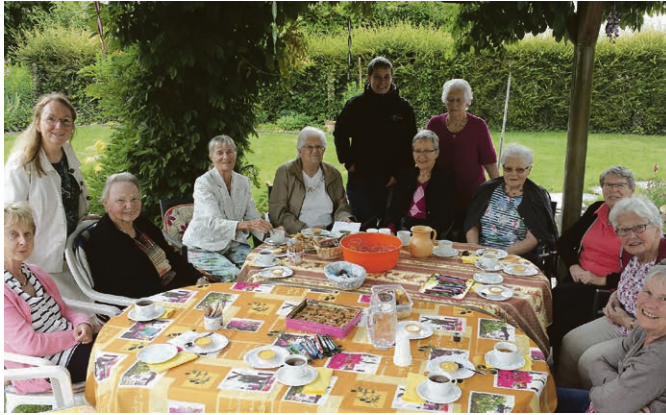
Gesprächskreis: Schön, einander wiederzusehen!