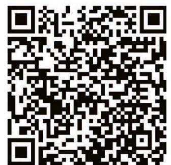
Inscription au rallye du 11 septembre.