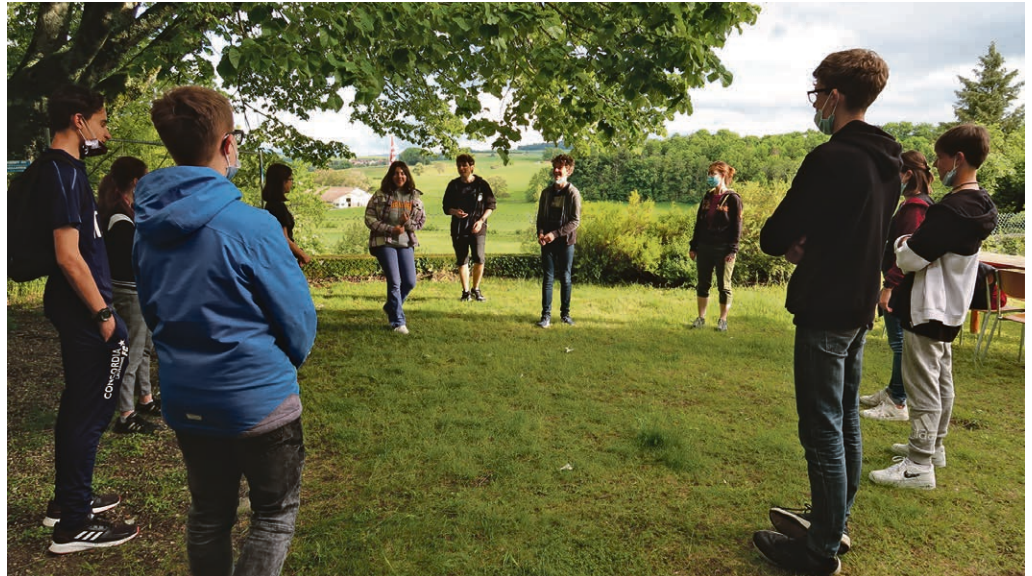
En cercle, pour jouer!

Samedi 11 septembre : rallye Touzâges, à vivre en famille ou entre ami·e·s, dès 6