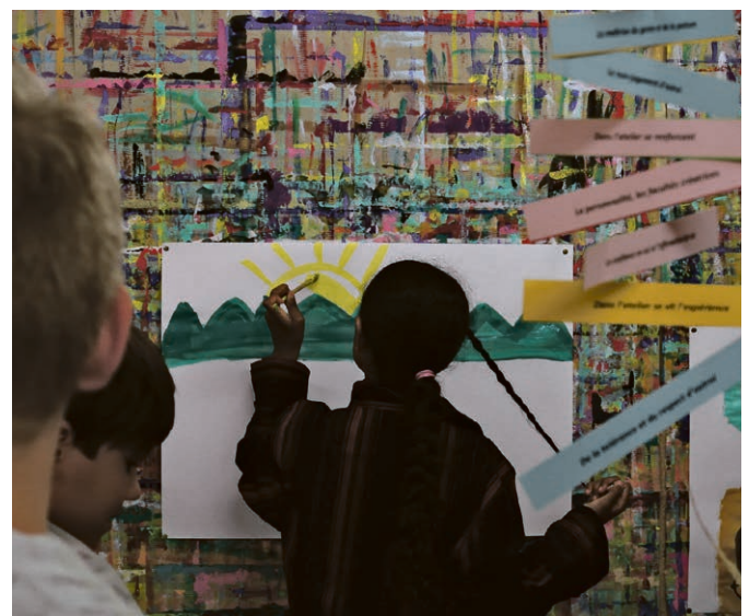
Le soleil apparaît!