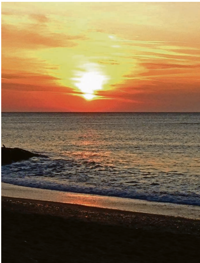
Lever du jour à Pietra Ligure.