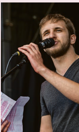
Benoît Ischer, écothéologien, qui présidera le culte du 5 septembre.

Dimanche 5 septembre, 10h15 , temple de Morges, culte en lien avec « Le Livre sur les quais » et la transition écologique et sociale. Prédicateur: Benoît Ischer, écothéologien.