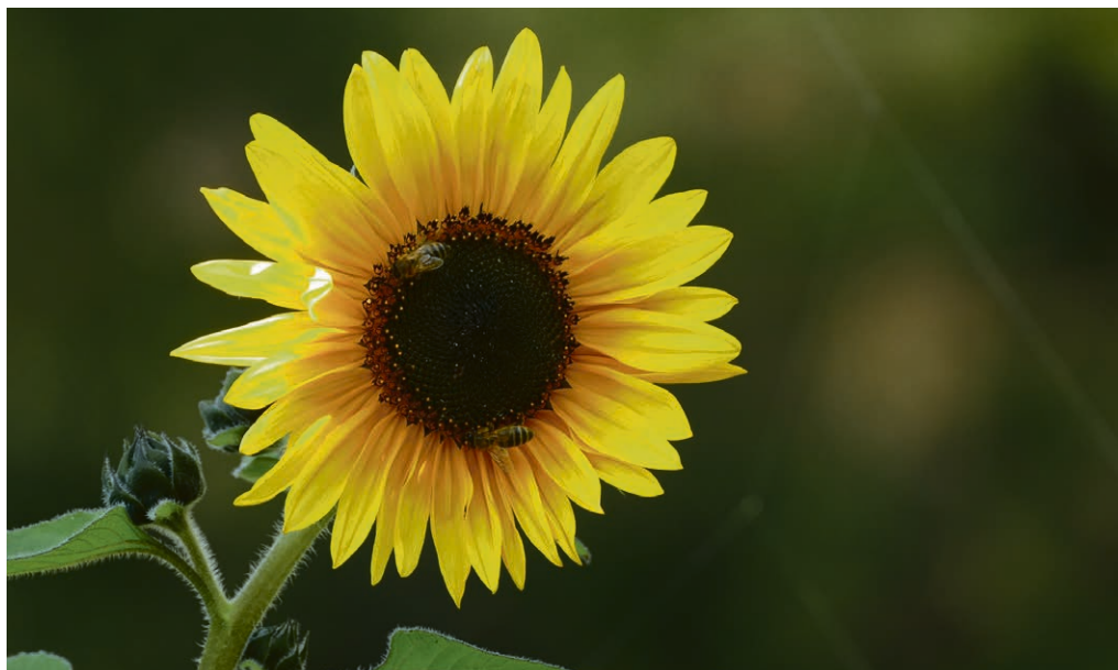
Comme le tournesol: tournons-nous vers la lumière!

Des personnes intéressées à effectuer des visites, à écrire une carte (lors d'un anniversaire), à passer un coup de fil... Vous êtes intéressé-e ? Renseignement : Claudine Masson Neal.