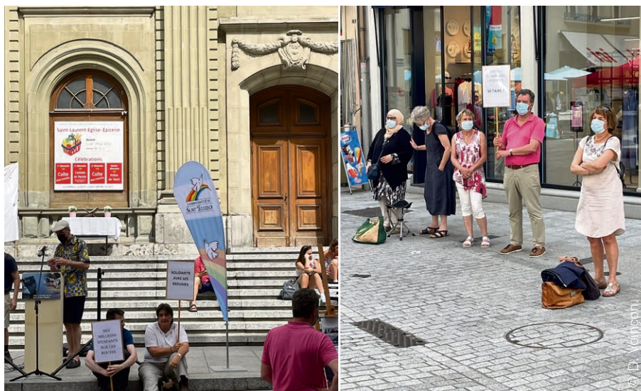
Unis dans la prière. Le 19 juin dernier, à Lausanne, célébration interreligieuse pour les personnes de toutes les religions décédées sur le chemin de l'exil.