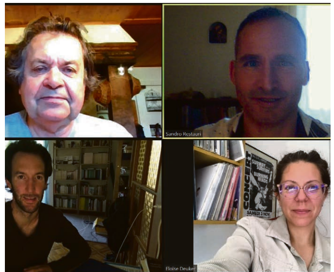
La nouvelle équipe de notre paroisse.

Dimanche 19 septembre, 10h, théâtre de Beausobre, Morges. Les différentes communautés chrétiennes de la région se retrouvent pour une célébration œcuménique sur le thème « Se bénir les uns les autres ». Voir aussi page 29.